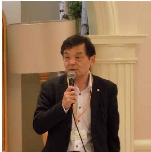
平間副会長 事業報告説明