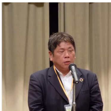
西小倉氏(テクノ菱和)