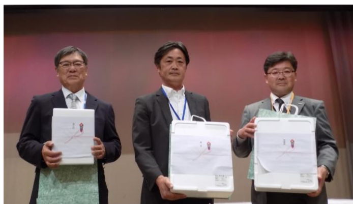
ゴルフ大会入賞者の皆様